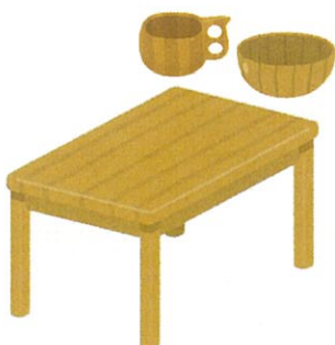
事務所・店舗の備品