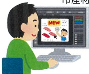
広告・宣伝等の費用