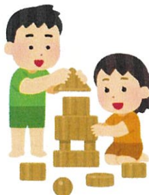
保育施設のおもちゃ